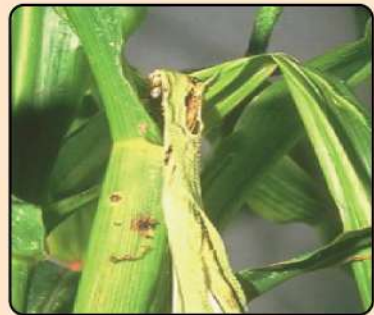
مکئی کی فصل پر سنی کی سنڈی کا حملہ